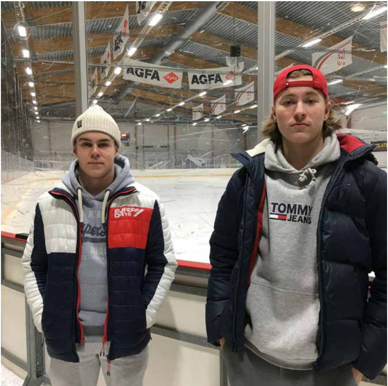
Jääkiekkoilijat hallilla, kuva Päivi Vanninen