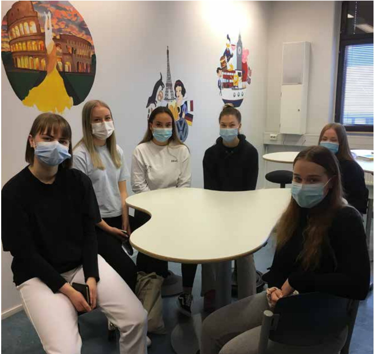
Tutoreita pienryhmässä