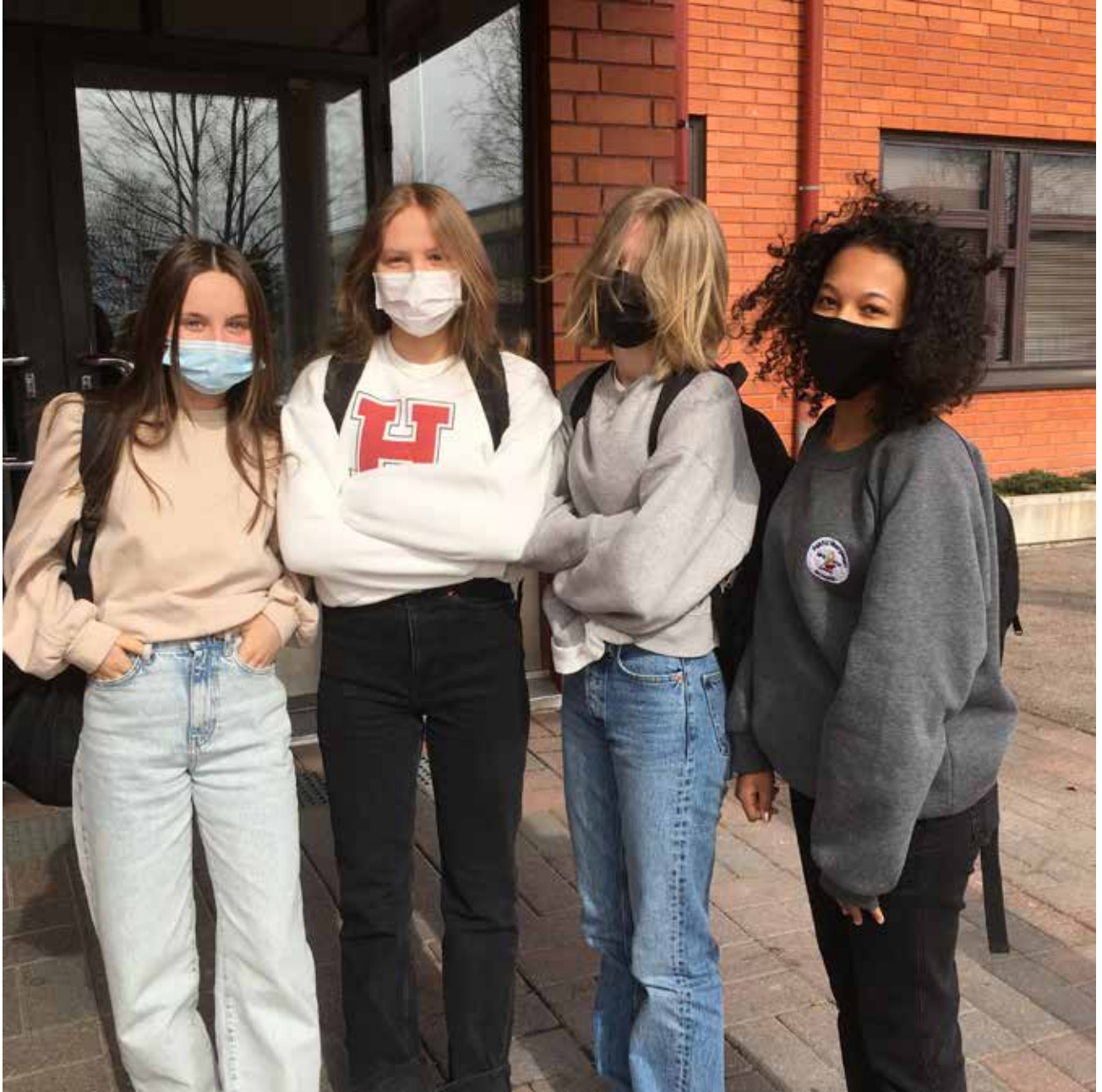
Opiskelijoita koululla