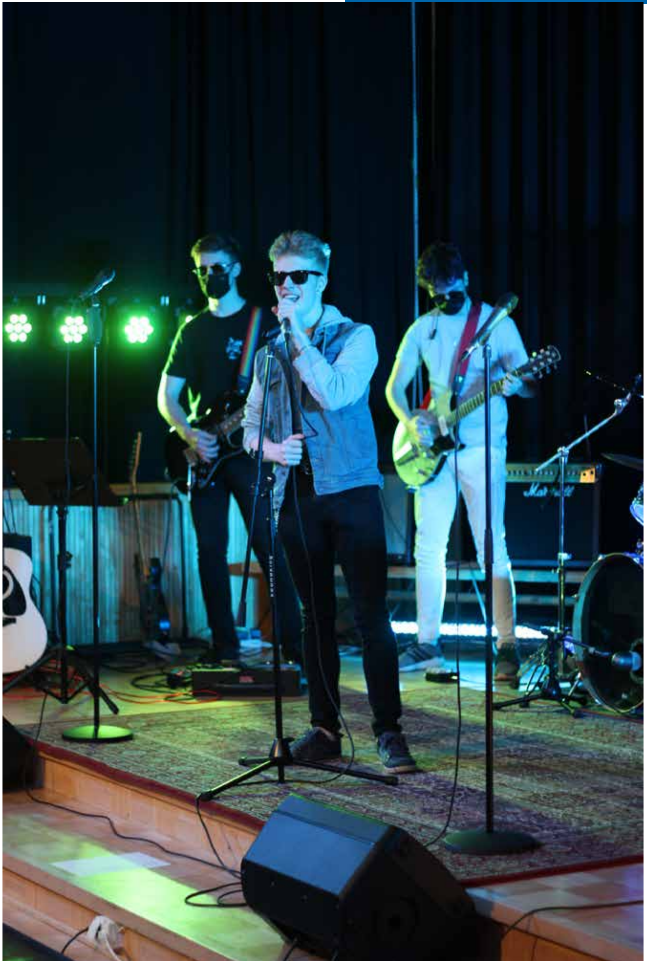
Taidelinjan näytönpaikka striimattiin toukokuussa