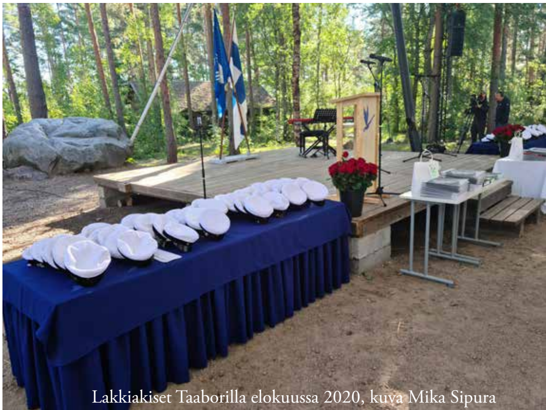
Lakkiakiset Taaborilla elokuussa 2020