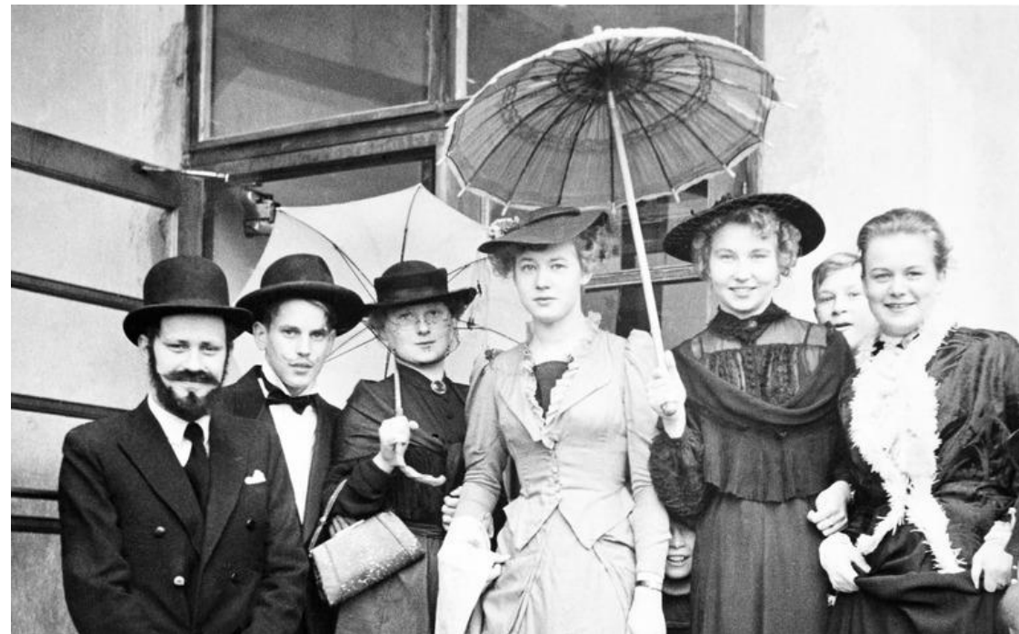
Arkadian yhteislyseon vanhat koulun pihalla 1953.